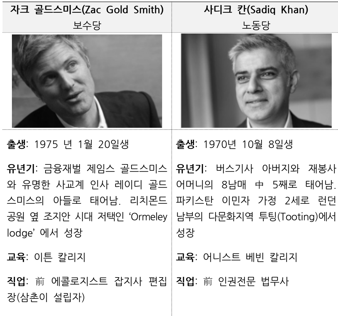
[표1] 2016 런던 시장선거 주요 후보 프로필